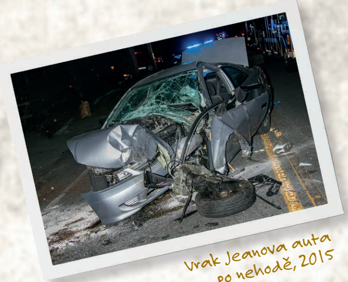
Vrak Jeanova auta po nehodě, 2015