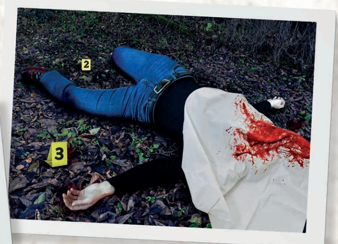
Rodinná tragédie. Vzpomínáme!