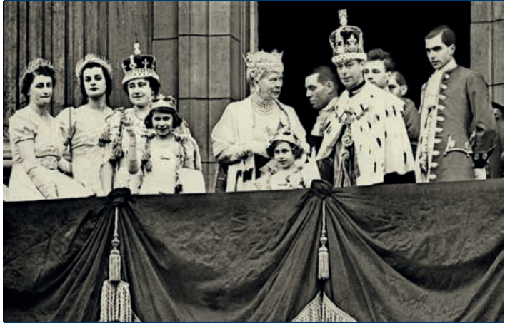
Královská rodina po korunovaci Jiřího VI.

V léčbě pak Bertie pokračoval až do počátku 30. let, kdy konzultace pomalu ustaly.