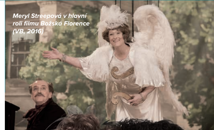
Meryl Streepová v hlavní roli filmu Božská Florence (VB, 2016)